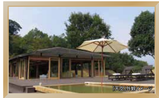
「天空」外観イメージ

ここは、究極のプライベートリゾート。広大な敷地に、たった5つのヴィラが点在しています。客室の露天風呂からの眺めは、360度の大パノラマ。お料理は、ほとんどが自家栽培の食材によるもの。高級魚やブランド肉だけがごちそうではないことを実感できます。