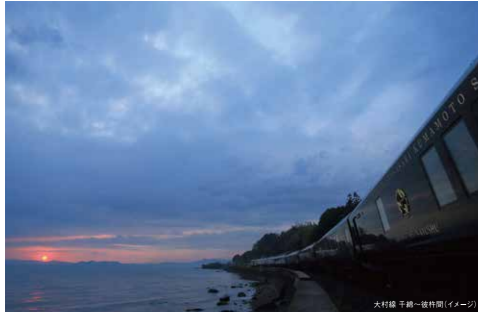
大村線 千歳～彼村間(イメージ)