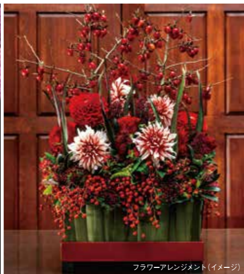
フラワーアレンジメント(イメージ)