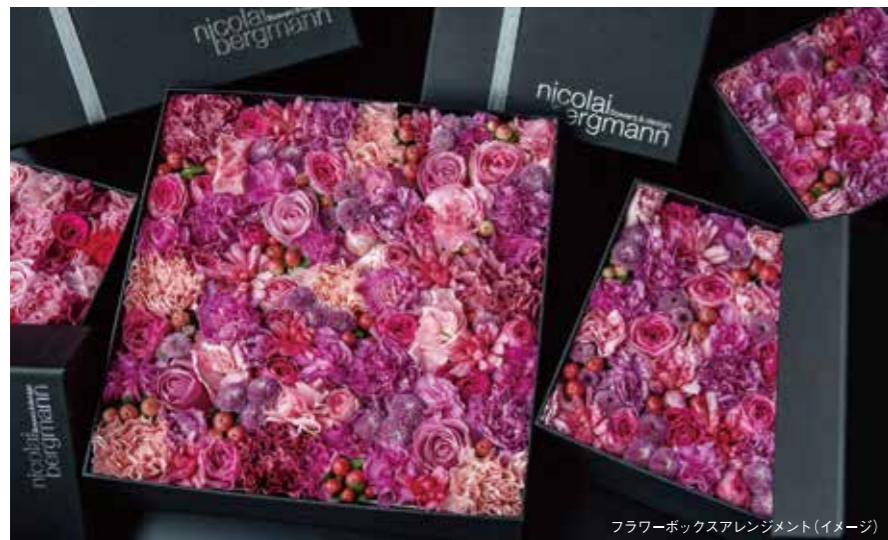
フラワーボックスアレンジメント(イメージ)